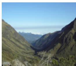
Colostethus delatorreae , rana nodriza amenazada En Peligro Crítico Vista panorámica del Cañón del Morán, última población registrada de Colostethus delatorreae